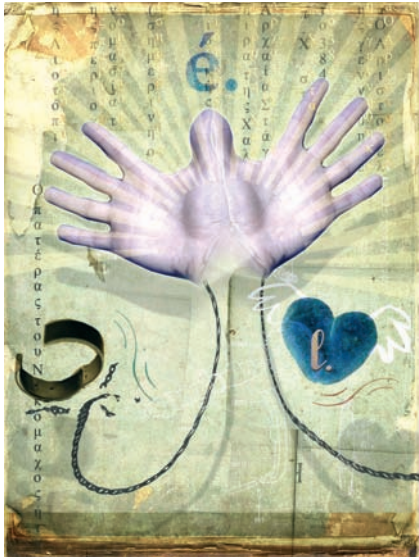
Fig. 2.2. La interpretación aristotélica del conocimiento.

Abstracción. Operación cognoscitiva mediante la cual, a partir de los datos sensibles que nos suministran nuestros sentidos, el entendimiento obtiene las esencias universales contenidas en las cosas.