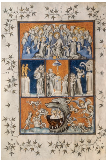
Fig. II.1. En esta iluminación de un manuscrito del siglo XVI se puede apreciar la contraposición entre la ciudad de Dios y la ciudad terrestre.

No obstante, los seres humanos podemos amar de un modo ordenado o de un modo desordenado. Amamos de modo ordenado cuando amamos a Dios sobre todas las cosas. Y amamos de un modo desordenado cuando nos dejamos arrastrar por nuestras pasiones: los honores, la fama, las riquezas, etc. Ahora bien, el amor ordenado nos acerca a nuestra meta, mientras que el desordenado nos aleja de ella.