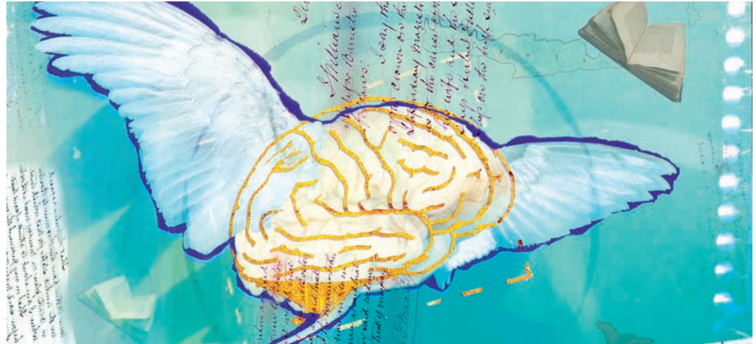
Fig. 2.6. Para Aristóteles el alma es la forma del cuerpo.