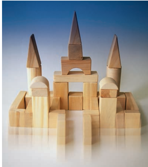
Fig. 2.5. Troncos de madera y escultura. En todo movimiento permanece la materia y cambia la forma.